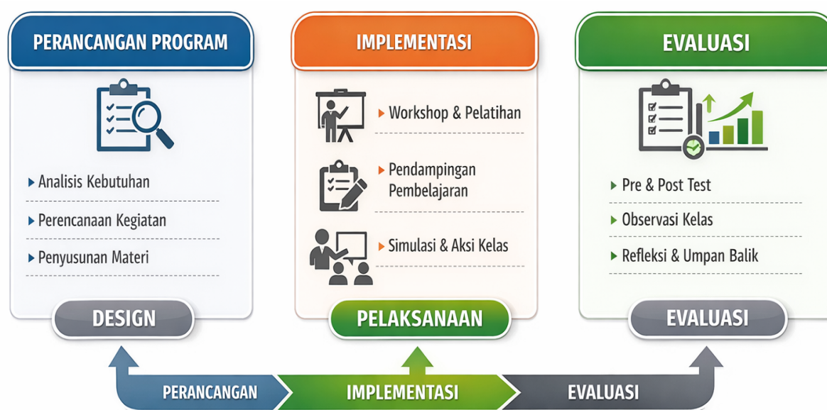
Gambar 1. Alur program pengabdian berbasis pendampingan ( design–implement–evaluate )

Kegiatan pengabdian ini dilaksanakan dibagi menjadi 3 tahap yang di jelaskan pada gambar berikut ini: