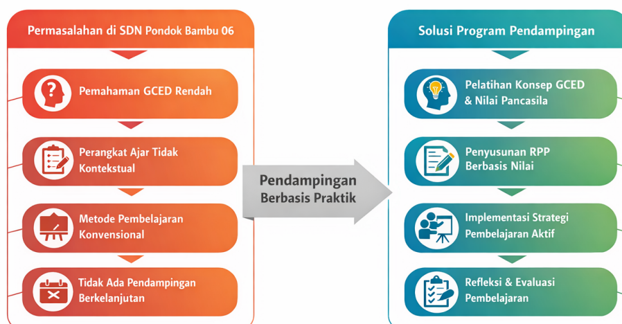
Gambar 2. Analisis masalah dan solusi program mitra pengabdian

Gambar 2 menggambarkan hubungan antara permasalahan yang dihadapi guru dengan solusi yang dirancang melalui program pendampingan. Permasalahan yang muncul mencakup rendahnya pemahaman guru terhadap konsep Global Citizenship Education (GCED), perangkat pembelajaran yang belum bersifat kontekstual, penggunaan metode pembelajaran yang masih berpusat pada guru, serta belum adanya pendampingan yang berkelanjutan.